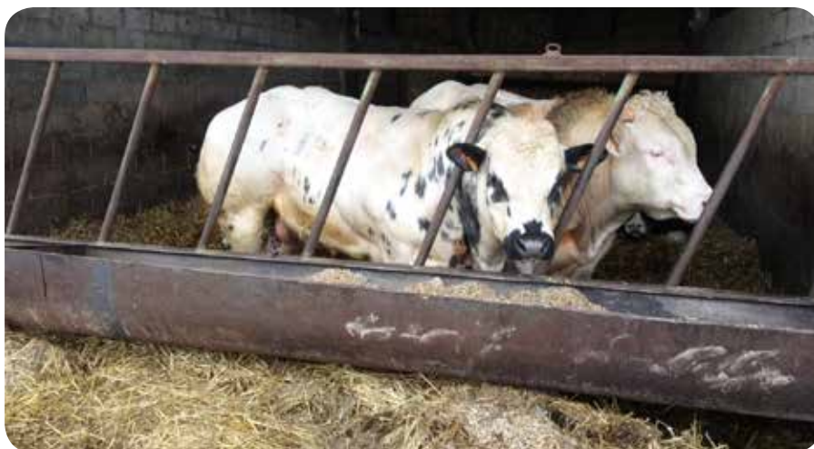
Pour la première fois, l'ensemble de la filière a accepté un rassemblement des exigences communes sous une même bannière (Belbeef) et garantit l'origine belge de la viande.

L'a.s.b.l. Belbeef, fondée en 1995, offre un système de certification complet pour la viande bovine belge, qui comprend tous les maillons de la production de viande bovine belge (« de la fourche à la fourchette ») et qui compile toutes les exigences communes des différents acheteurs. L'intention était également de rationaliser le nombre de contrôles, le nombre d'analyses et les coûts y afférents pour les agriculteurs.